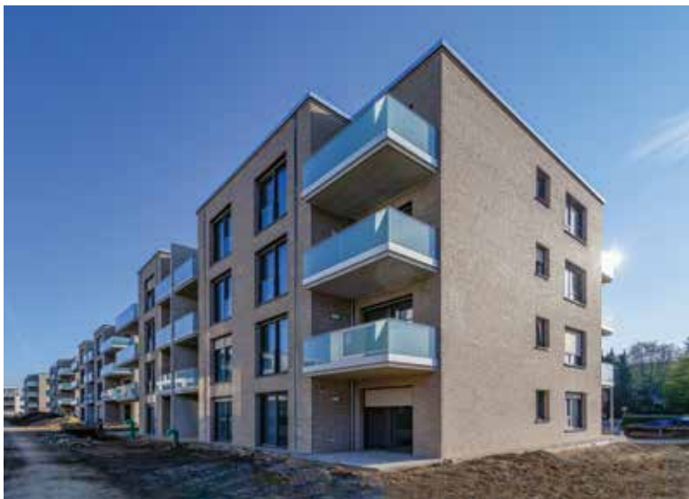
Neubaumaßnahme Grünwaldstraße, Dornberg - Foto: Gábor Wallrabenstein