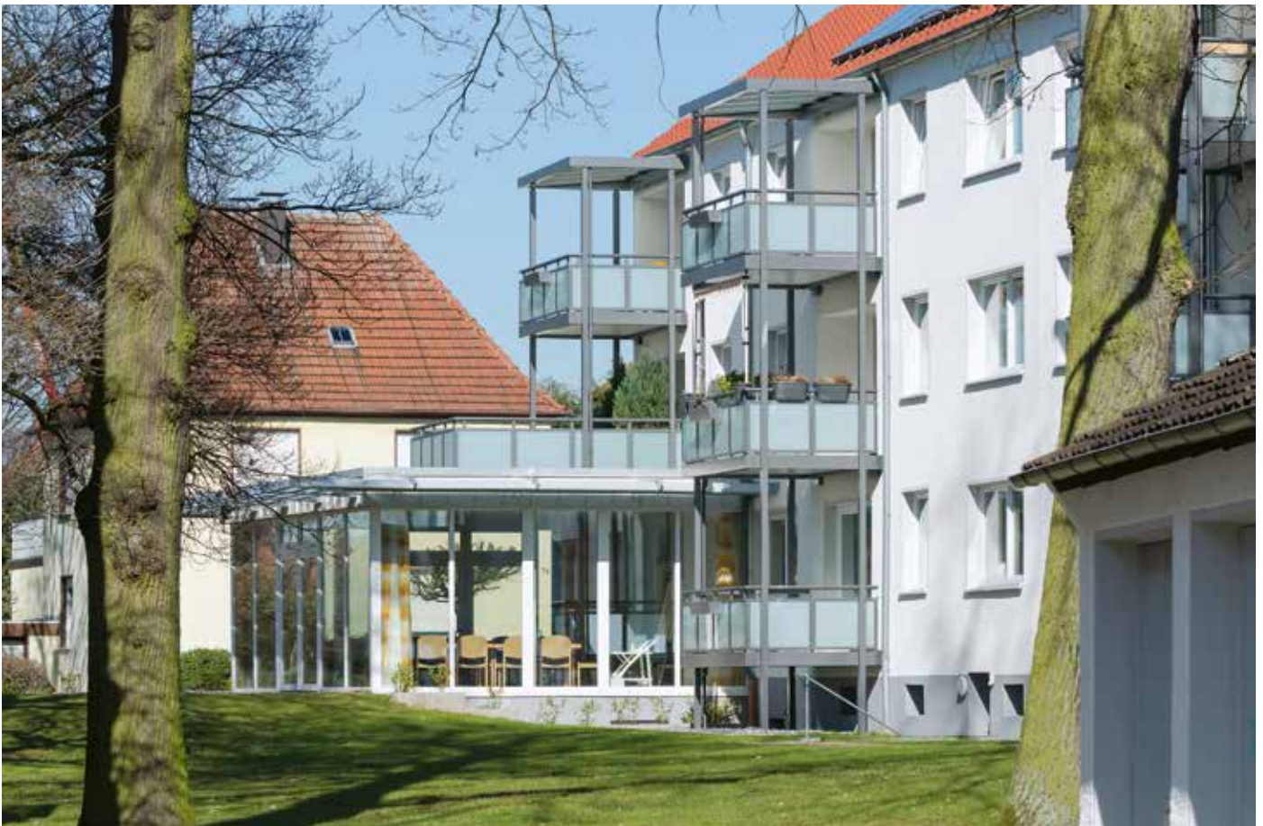
Uthmannstraße 13/13a mit Nachbarschaftstreff

Der seit 2022 bestehende Ukrainekrieg hat zu einem deutlichen Anstieg der Bau- und Verbraucherpreise geführt und in der Folge zu einem massiven Anstieg der Bauzinsen. Zusätzlich haben die Anforderungen des Gebäudeenergiegesetzes den Druck auf die Preise weiter erhöht. Risiken bestehen insoweit zunehmend in der wirtschaftlichen Umsetzung energetisch erforderlicher Bestandsinvestitionen einschließlich zukünftiger Neubauprojekte. Daneben besteht zunehmend ein Fachkräftemangel bei der Durchführung der erforderlichen Maßnahmen.