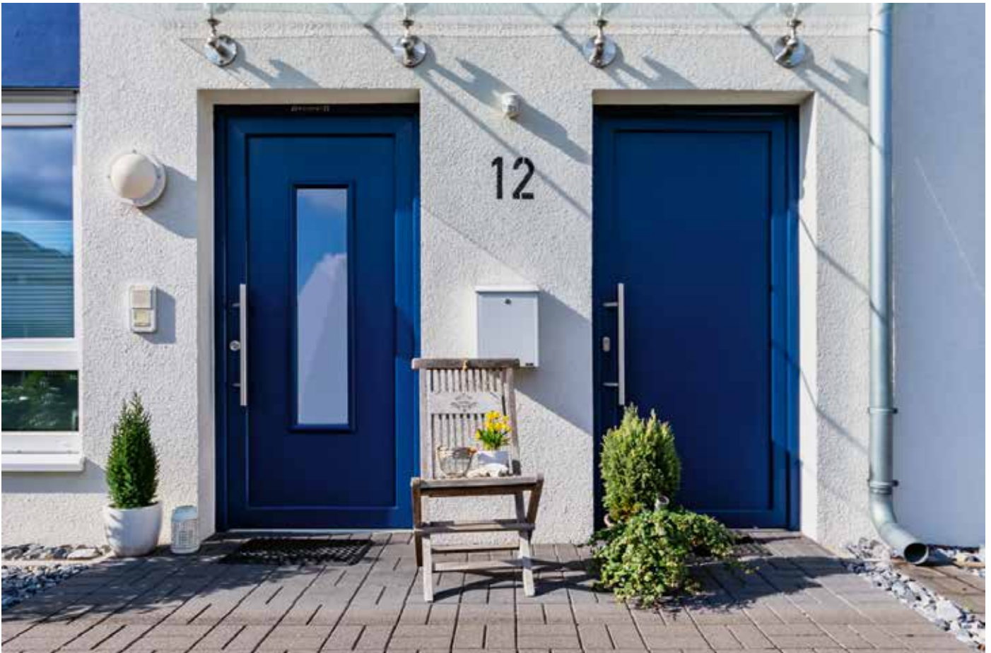
Bonner Straße 12-18