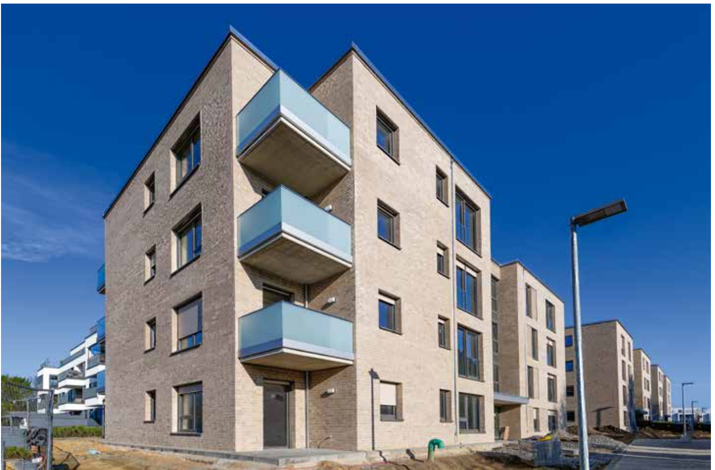
Neubaumaßnahme Grünewaldstraße, Dornberg

Die Wohnungen betreffen vorwiegend Zwei- und Dreizimmerwohnungen mit Wohnflächen von 45 m 2 bis 81 m 2 . Die Mieten der freifinanzierten Wohnungen liegen größtenteils bei 11,40 € je m 2 , die Mieten der öffentlich geförderten Wohnungen sind mit 6,40 € je m 2 Wohnfläche eingestuft.